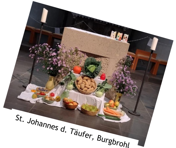
St. Johannes d. Täufer, Burgbrohl