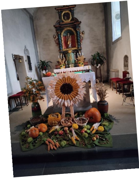
St. Vitus, Weiler