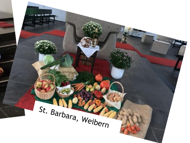
St. Barbara, Weibern