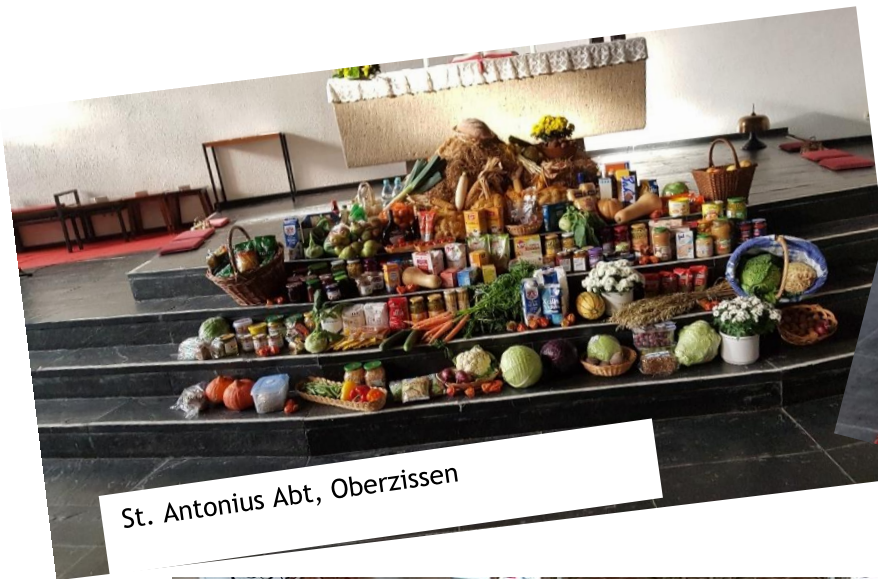
St. Antonius Abt, Oberzissen