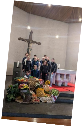
St. Germanus, Niederzissen