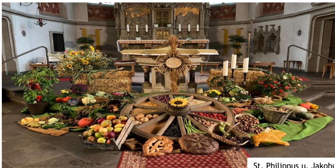
St. Philippus u. Jakobus, Kempenich